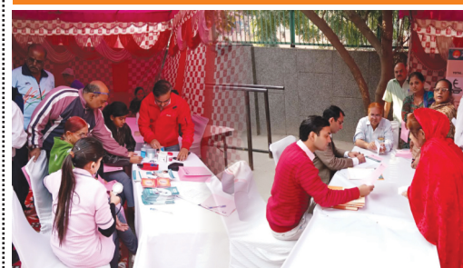
Nov 26 : 110 Patients attended the multi speciality health check up camp in association with RWA Karampura, at New Moti Nagar.