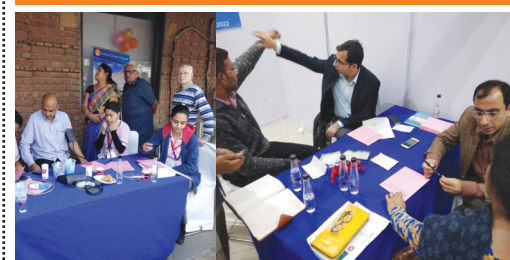
Nov 19 : 105 Patients attended the multi speciality health check up camp in association with Krishan Sudama Welfare Society at Delhi Haat, Pitampura.