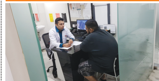
Nov 11 to 12 : 29 Patients attended Obesity Check up camp/ Bariatric Surgery Camp at Sri Balaji Action Medical Institute.

All consultants are requested to kindly update Medical Director about the advanced and complicated surgeries performed so that same can be provided to PR Agency for publicity